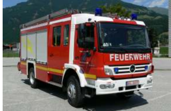
HLF 20/16 (Hilfeleistungslöschgruppenfahrzeug)