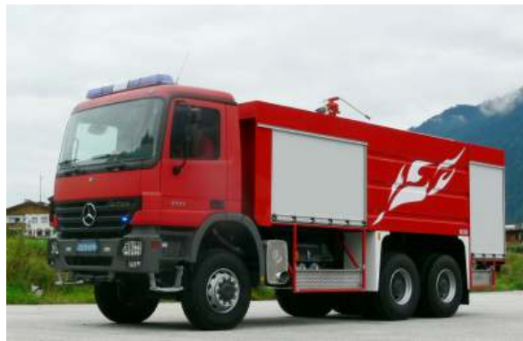
TLF 8000/2000 (Tanklöschfahrzeug), Gabun