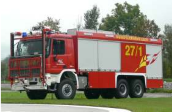
ULF (Universallöschfz.) 7500/1000/500/240