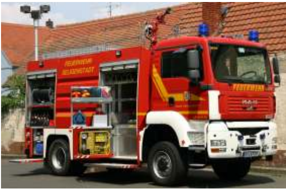
TLF 20/40 (Tanklöschfahrzeug)