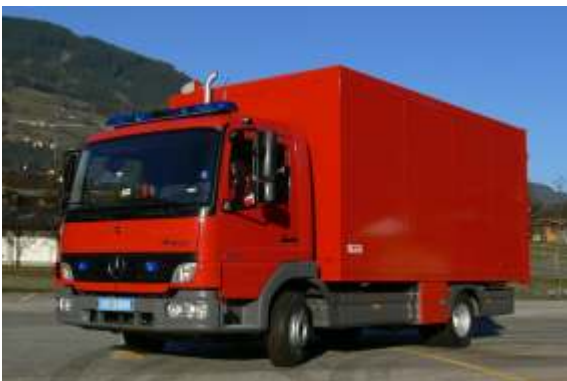
Atemschutzfahrzeug, Tschechische Republik