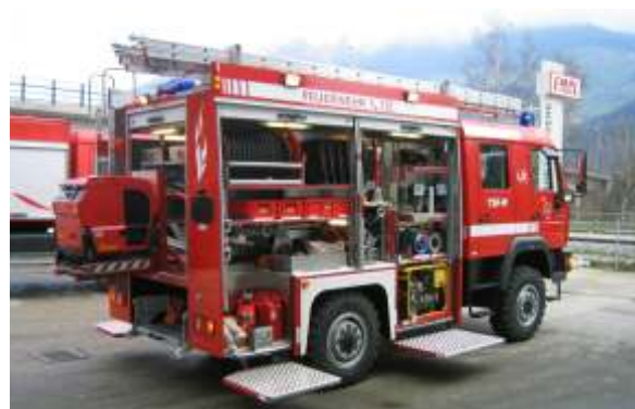
TSF-W (Tragkraftspritzenfahrzeug mit Wassertank)