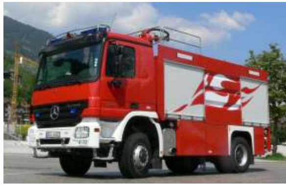
TLF 24/50 (Tanklöschfahrzeug)