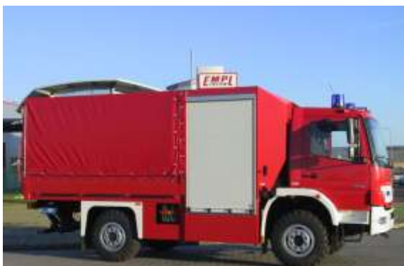
SW 2000 (Schlauchwagen)