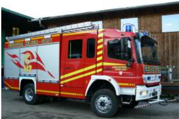
LF 20/16 (Löschgruppenfahrzeug)