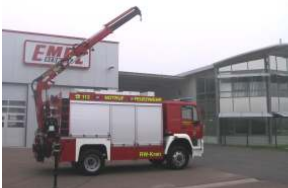
RW-Kran (Rüstwagen mit Kran)