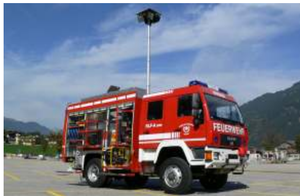
RLF-A 2000 (Rüstlöschfahrzeug), Italien