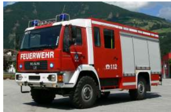
LF 10/6 (Löschgruppenfahrzeug)