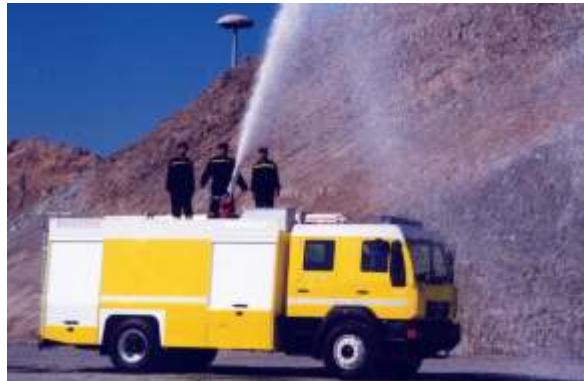
ULF (Universallöschfahrzeug), Oman