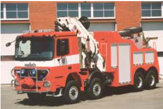
Schweres Bergfahrzeug mit Kran, Polen