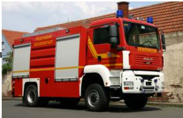
TLF 20/40 SL (Tanklöschfahrzeug, 4.000 Lit. Wasser)