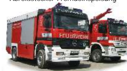
Der Empl-Fuhrpark der BTF OMV

Zusätzliche Ausstattung: Manövrierscheinwerfer Abreißstecker Fremdeinspeisung