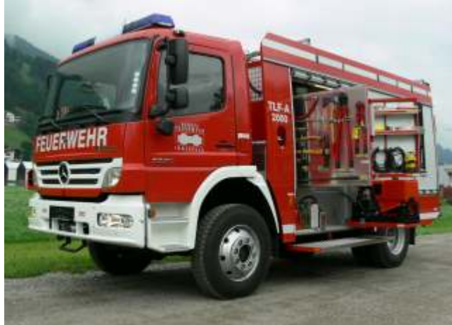
TLF-A 2000 (Tanklöschfahrzeug, 2000 Lit. Wasser)