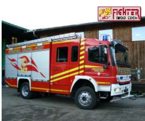
LF 20/16 (Löschgruppenfahrzeug, 2000 Lit. Wasser)