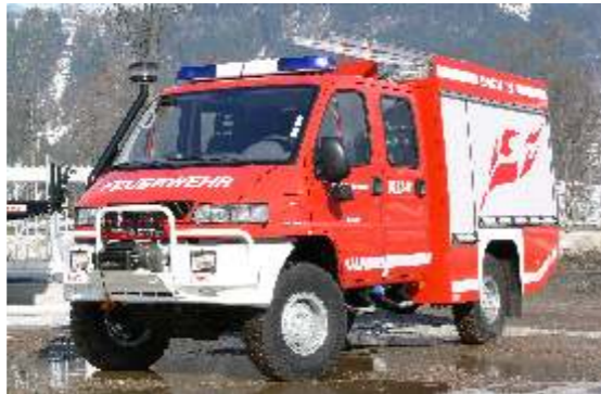
KLF-W (Tragkraftspritzenfahrzeug mit Tank)