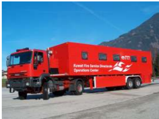
Mobile Einsatzleitzentrale (ähnlich ELW 3)