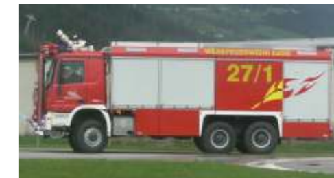
Der Empl-Fuhrpark der BTF EADS