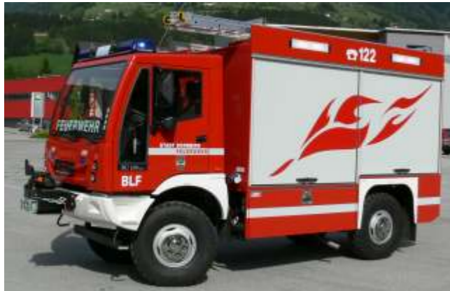
BLF (ähnlich TSF-W)