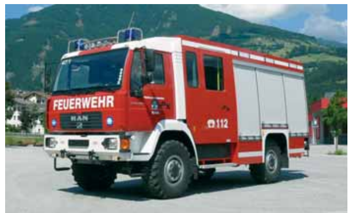
Пожарный автомобиль Fire Fighting Vehicle