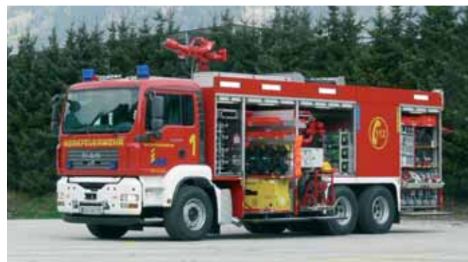
Промышленный пожарный автомобиль 4.000/2.000/1.500/240 Industrial Fire Fighting Vehicle 4.000 / 2.000 / 1.500 / 240