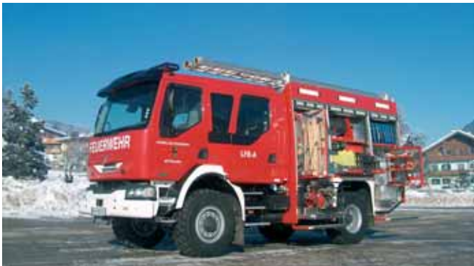
Пожарный автомобиль с переносным насосом и спасательным снаряжением Fire Fighting Vehicle with portable pump and rescue equipment