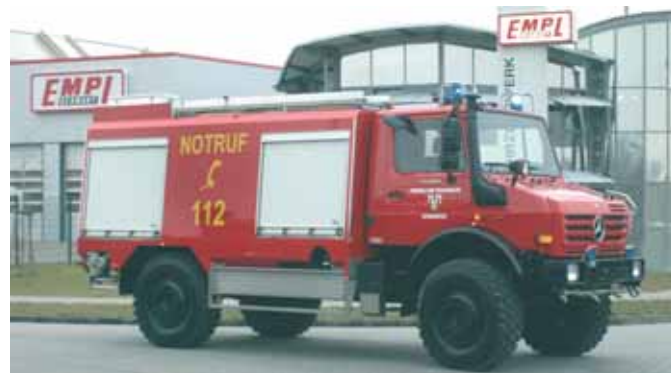
Автоцистерна для тушения пожаров повышенной проходимости Tank Fire Fighting Vehicle with off-road capability