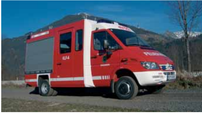
Вспомогательный пожарный автомобиль Support Vehicle