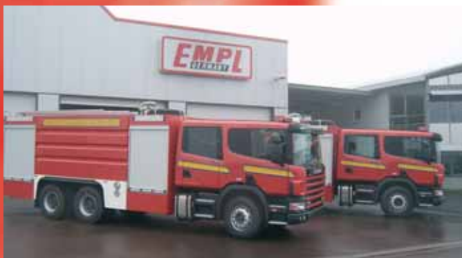
Автоцистерна для тушения пожаров Fire Fighting Vehicle with water tank