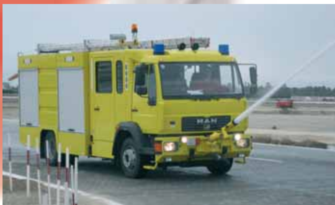
Автоцистерна для тушения пожаров Fire Fighting Vehicle with water tank