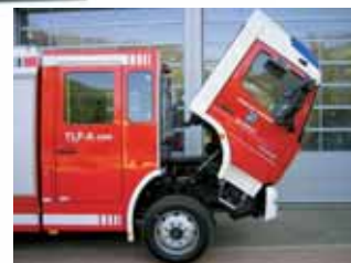
Пожарная машина Fire fighting vehicle

алюминий-панель и модуль GRP кабина Full aluminium panel system and GRP-cab modul