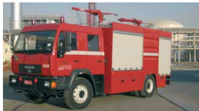
Автоцистерна для тушения пожаров Fire Fighting Vehicle with water tank