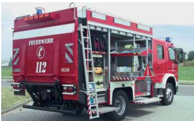
Аварийный автомобиль/транспортирующая машина Rescue & Transport Vehicle