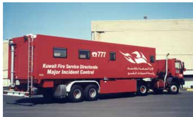
Автомобиль оперативного управления Command Control Unit