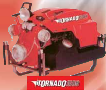
EMPL портативный насос EMPL portable pump

Thanks to the compact, fully-developed body concept, EMPL set new quality standards in fire fighting. After having successfully introduced the aluminium-plastic honeycomb technology at the Interschutz 2000 (EMPL Alu-tech), EMPL presented an other innovative technology highlight in 2004 – the EMPL Fire Fighter MOD-Tech. Characteristic for the MOD-Tech-Concept are the 3 totally independently mounted modules: the driver's cab, the crew cab and the equipment body. This technology permits all necessary torsions of the chassis during hard off-road operations! Additionally, MOD-Tech Vehicles are 100% corrosion resistant. 10 years warranty granted by EMPL! The generously-dimensioned crew cab provi-