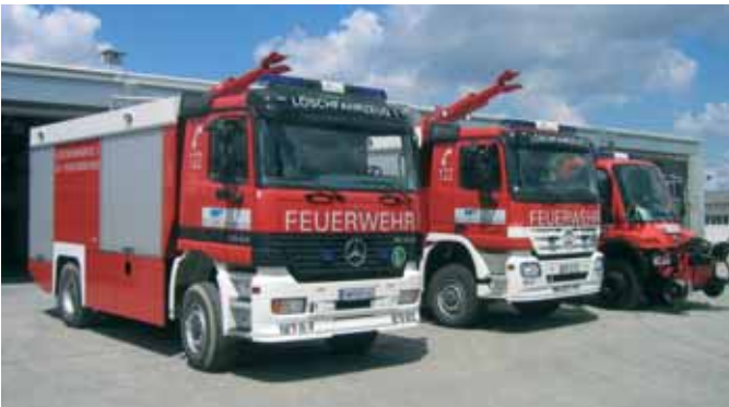
Промышленный пожарный автомобиль (для нефтеперерабатывающего завода) Industrial (Refinery) Fire Fighting Vehicle