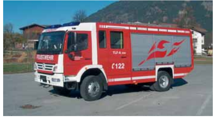
Автоцистерна для тушения пожаров Fire Fighting Vehicle with water tank