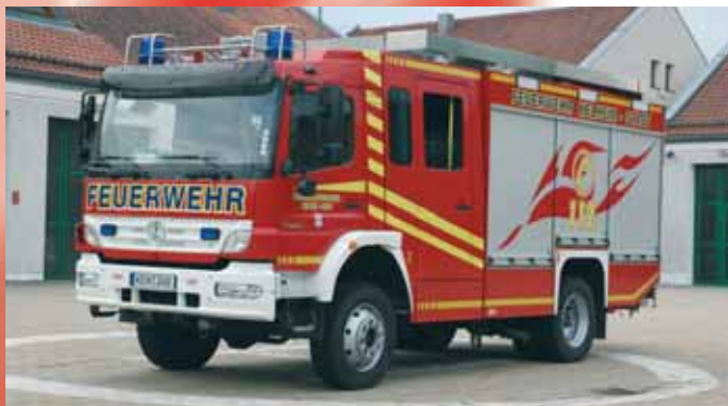
Пожарный автомобиль Fire Fighting Vehicle