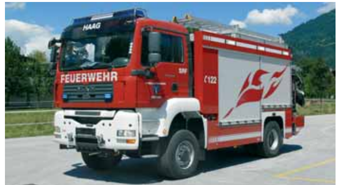
Большегрузный аварийный автомобиль Heavy Duty Rescue Vehicle