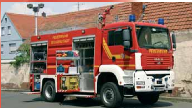
Автоцистерна для тушения пожаров Fire Fighting Vehicle with water tank