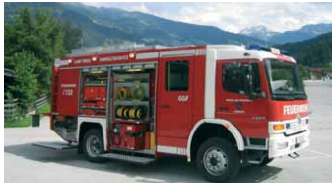
Перевозочное средство огнеопасных материалов Hazardous Material Vehicle